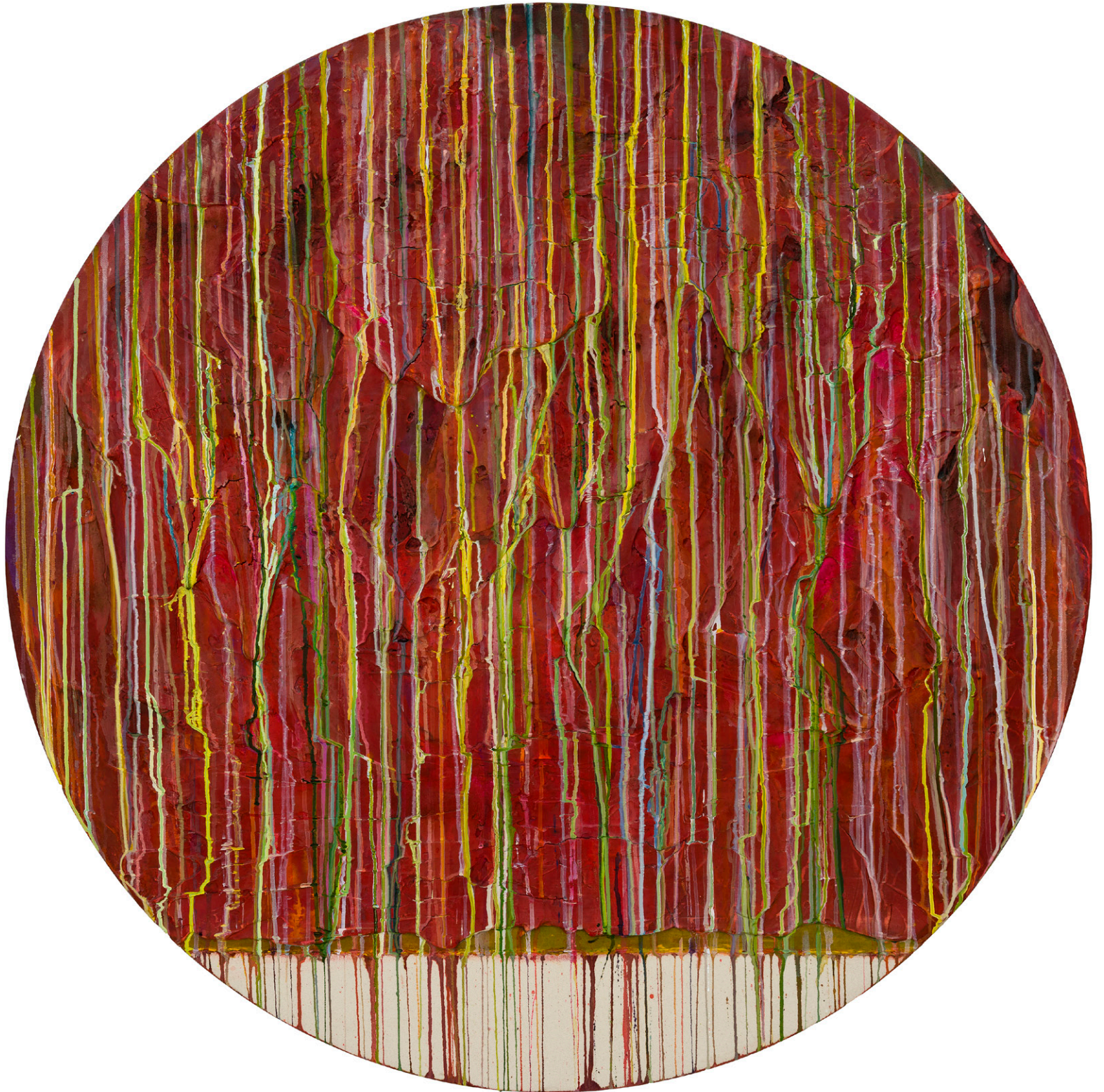
Dreamcatcher Series #2 2024 Tondo 48 in. Acrylique, plâtre, composé et encre sur toile