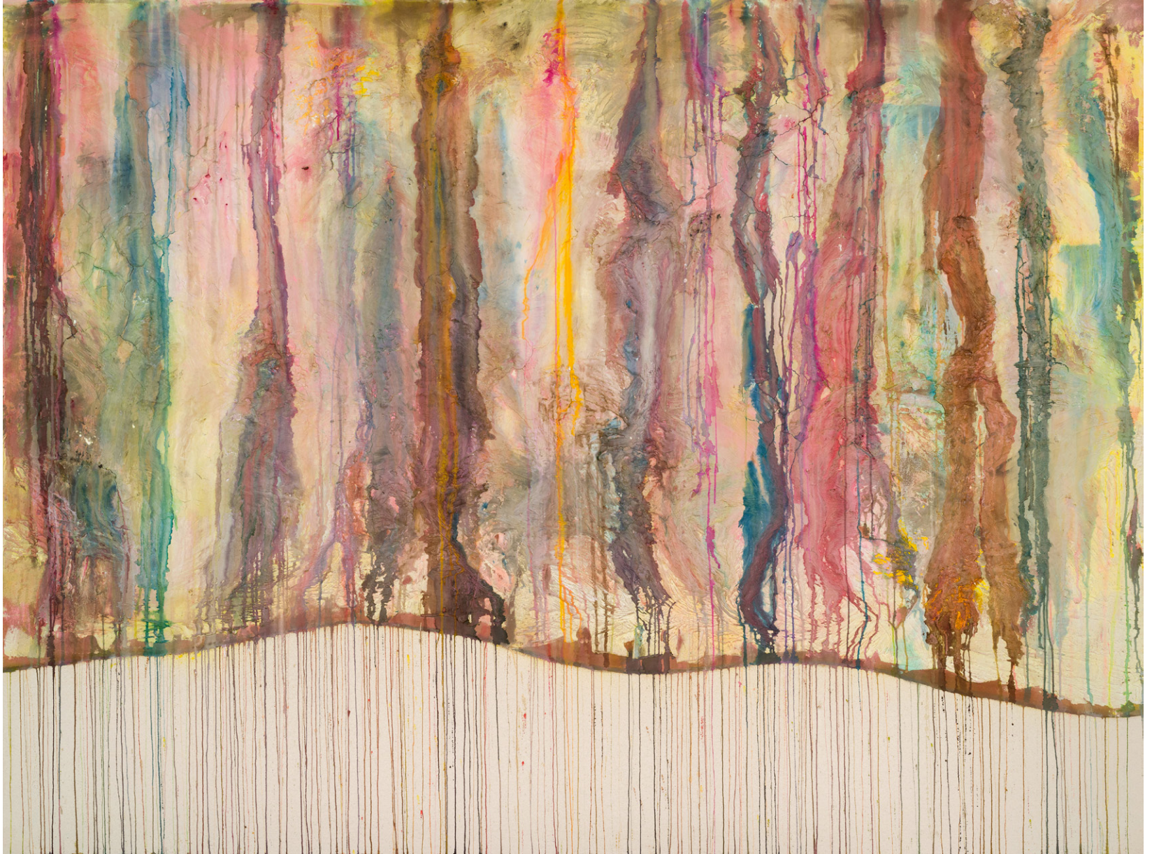
Tolantongo, Chronicles of Stone Earth's Subterranean Odyssey 2024 72 x 96 in. Acrylique, plâtre, composé et encre sur toile