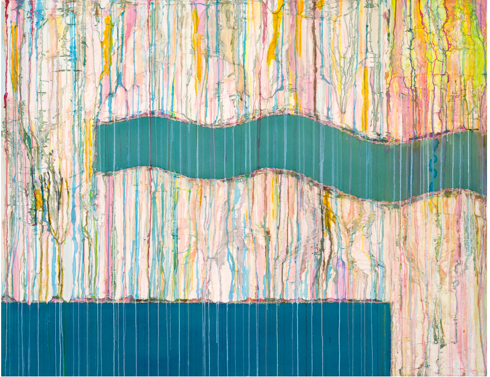
Babilonia's Garden 2024 56 x 72 in. Acrylic, plaster compound and ink on canvas