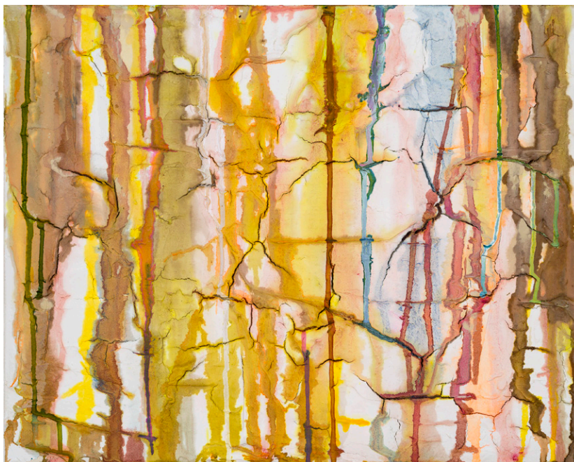
Tolantongo Series #5 2024 20 x 16 in.

Un petit groupe de tondos intitulés “Série Attrape-rêves”, ainsi que quelques pièces mélodieuses intitulées “Tolantongo”, “Jardin de Babylone”, “Jardin de la maison à Sydney, Australie”, “Jardin de Villa D’Este”, “Les jardins de l’Alhambra II”, reflètent cette tendance. En tant que culmination élaborée et validation de la redécouverte par l’artiste d’une abstraction gestuelle enrichie, la peinture intitulée “Sérénade au coucher du soleil, une mélodie de fleurs sauvages au crépuscule” encapsule particulièrement son expédition artistique revitalisée.