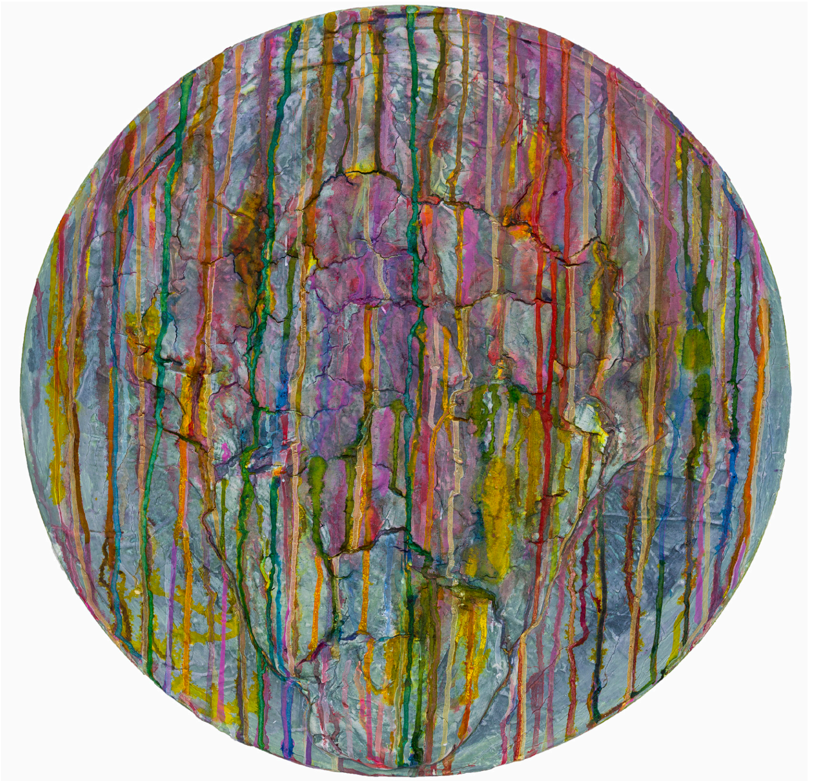
Dreamcatcher Series #1 2023 Tondo 24 in. Acrylique, plâtre, composé et encre sur toile