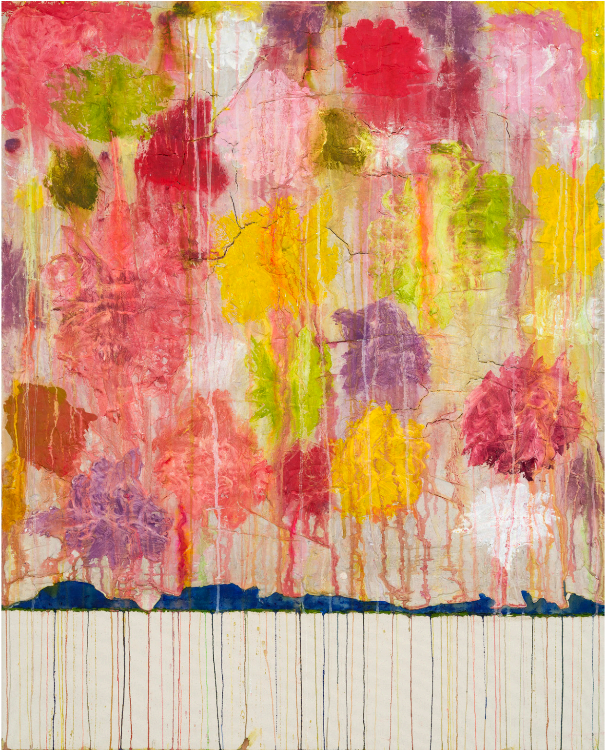
The Garden of Villa d'Este Italy 2023 50 x 40 in. Acrylique, plâtre, composé et encre sur toile