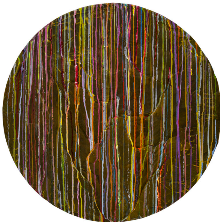
Dreamcatcher Series #3 2024 Tondo 24 in.