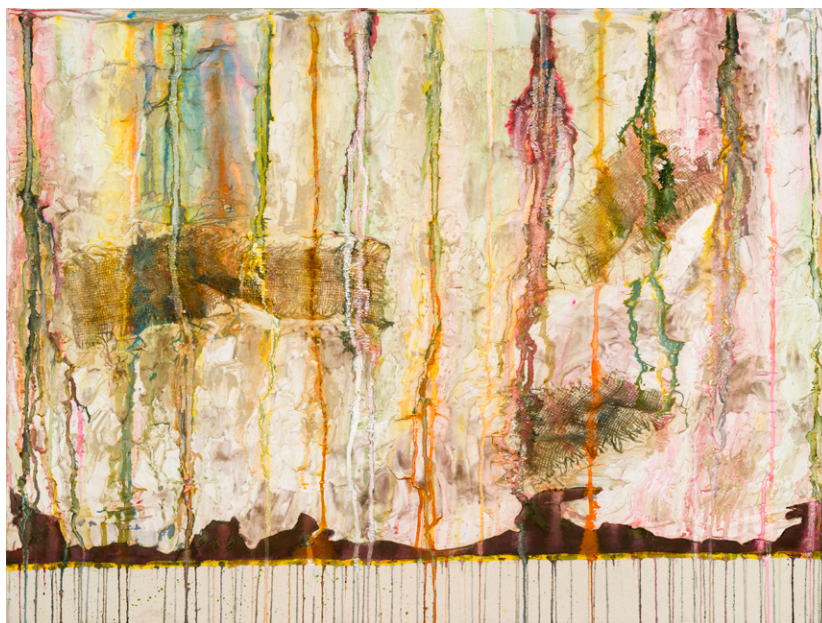
Garden of Villa D'Este 2023 40 x 30 in.

evocar el paso del tiempo, similar al proceso de envejecimiento natural observado en los jardines históricos.