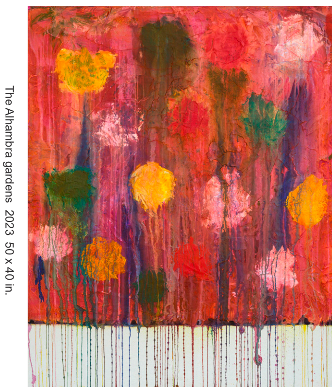
The Alhambra gardens 2023 50 x 40 in.

Ma curiosité m'a incité à approfondir. Je me demandais : "Pourquoi le changement révolutionnaire soudain dans la pratique de Luis-Fernando ?" L'artiste a expliqué : en 2014, il avait visité une exposition, intitulée "Paradis", d'œuvres de Cy Twombly (1928-2011) à la Fondation d'art contemporain Jumex au Mexique. Cette exposition l'a grandement inspiré à suivre un nouveau chemin. Connu pour ses grandes peintures emblématiques composées de marques en boucle et de gribouillis, Twombly est un artiste américain pionnier qui est arrivé à l'âge adulte après le mouvement de l'expressionnisme abstrait. Il a passé des décennies à Rome et dans la ville portuaire médiévale de Gaeta, s'immergeant dans l'art, la culture, la littérature et l'histoire méditerranéenne. Fasciné par l'émail qui gouttait des artefacts grecs, Twombly a commencé à incorporer des gouttes dans ses propres formes abstraites florales griffonnées, symbolisant l'amour, l'art, la beauté, le vieillissement et la mort dans une série de peintures des années 2000. Cette série tardive de la carrière de Twombly est devenue profondément ancrée dans l'esprit de Luis-Fernando.