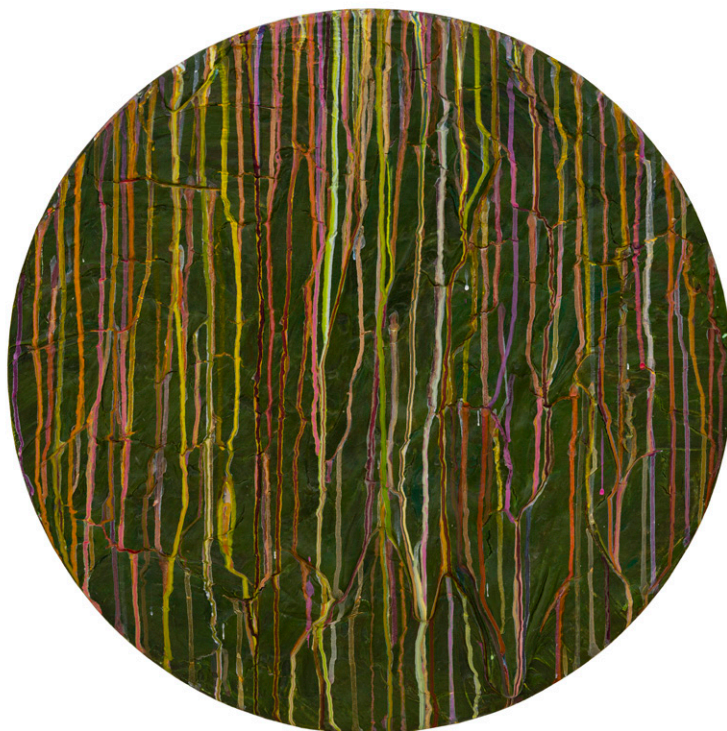
Dreamcatcher Series #4 2024 Tondo 24 in.

El impresionante gran tondo titulado "Efímera Flor: Una Sonata Matutina de Flora Salvaje", "El Jardín de Villa d'Este, Italia" y "Los Jardines de la Alhambra" surgieron de esta evolución; los agarré al instante. Paralelamente a esta nueva exploración pictórica, el artista también redujo sus gestos en lienzos concurrentes que presentaban goteos minimalistas puros sobre el telón de fondo de estructuras elegantes.