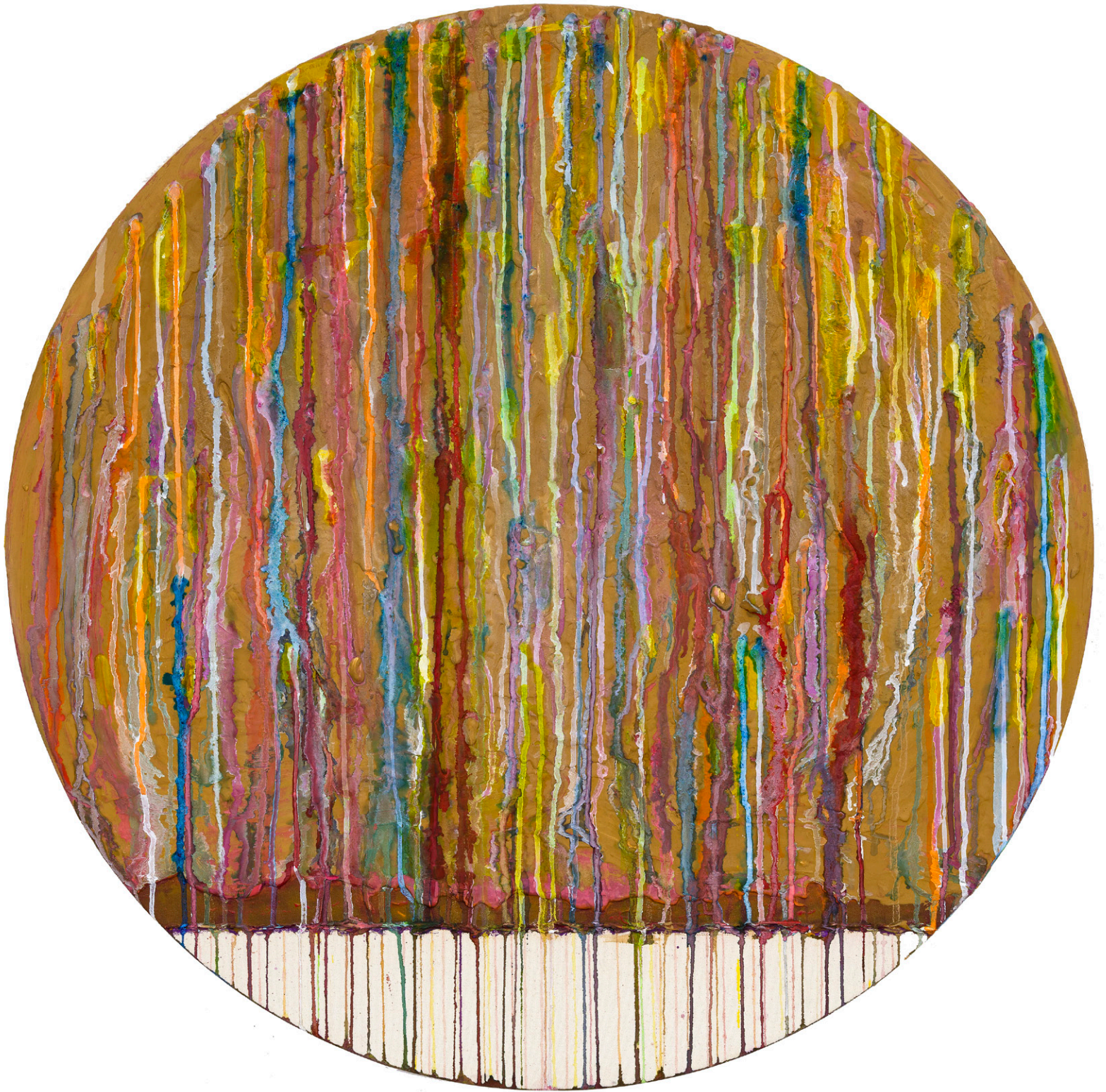
Eternal Rounds (Dreamcatcher series) 2023 Tondo 36 in. Acrylic, plaster compound and ink on canvas