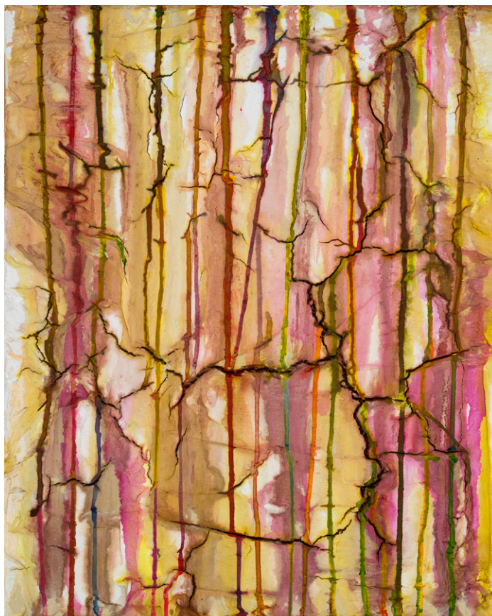
Tolantongo Series #2 2024 20 x 16 in.

By integrating these tactile elements into my work, I aim to elicit a visceral response from viewers, encouraging them to contemplate the rich history and profound significance of gardens throughout human civilization. Each crack and texture within the paintings serves as a narrative, suggesting the resilience and enduring beauty that is inherent in these timeless landscapes.”