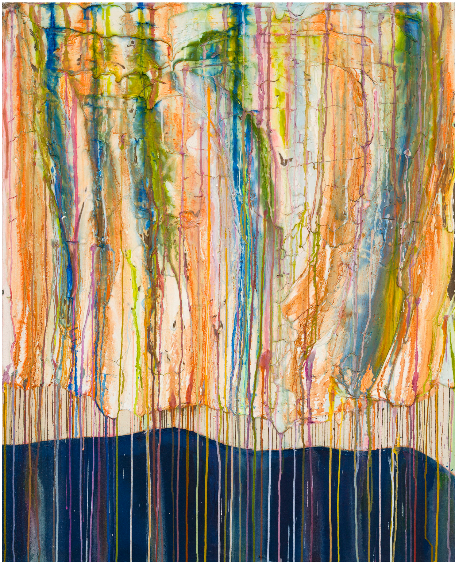
House Garden in Sydney Australia 2023 40 x 50 in. Acrylic, plaster compound and ink on canvas