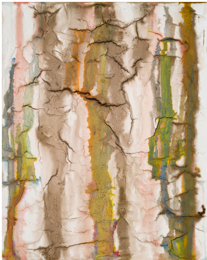
Tolantongo Series #1 2024 20 x 16 in.

Explorer le sens d'un 'jardin' pour la société est ce qui m'a motivé à produire une série qui se concentre sur les jardins anciens qui ont laissé une marque indélébile dans la société. Dans ma pratique artistique, j'utilise le plâtre et le béton comme mes principaux matériaux. À travers des méthodes d'application soigneuses, j'introduis des textures, des fissures et des imperfections dans mes peintures, leur donnant un caractère distinctif et une vitalité particulière. Ces manipulations délibérées des matériaux servent à évoquer le passage du temps, similaire au processus de vieillissement naturel observé dans les jardins historiques. En intégrant ces éléments tactiles dans mon travail, mon objectif est de susciter une réponse viscérale chez les spectateurs, les encourageant à contempler la riche histoire et la profonde signification des jardins à travers la civilisation humaine. Chaque fissure et texture dans les peintures sert de récit, suggérant la résilience et la beauté durable inhérentes à ces paysages intemporels.