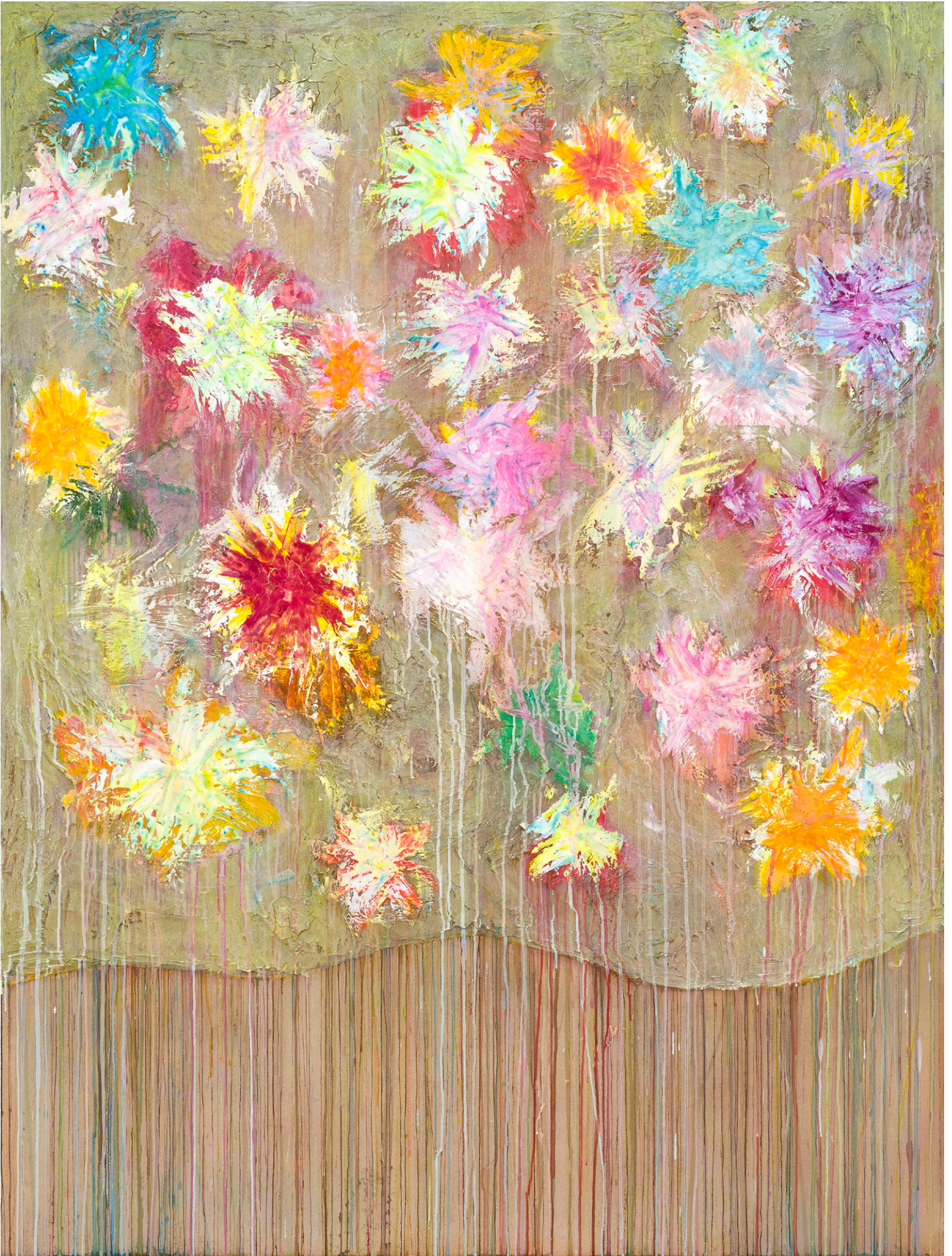
Sunset Serenade, a melody of Wildflowers in Twilight 2024 96 x 72 in. Acrylique, plâtre, composé et encre sur toile