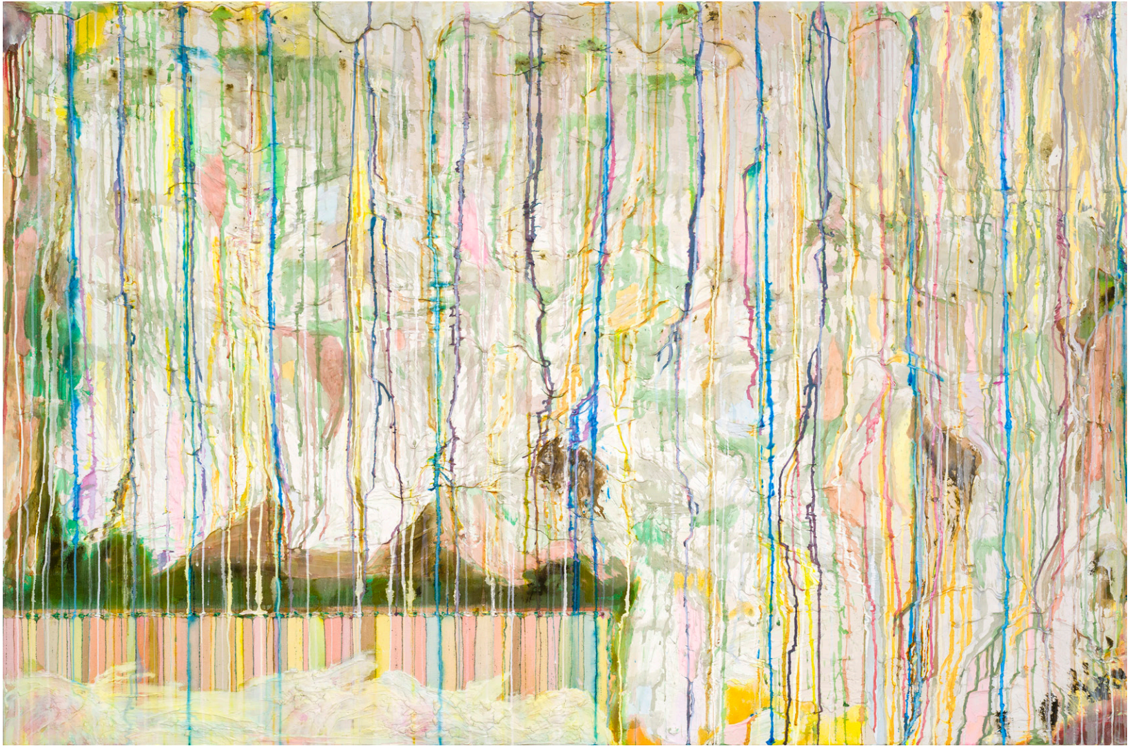
Alhambra Gardens II 2023 48 x 72 in. Acrylic, plaster compound and ink on canvas