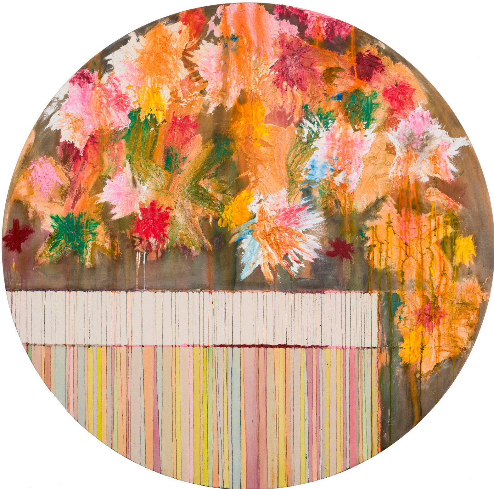
Ephemeral Bloom A Morning Sonata of Wild Florae 2023 Tondo 72 in.